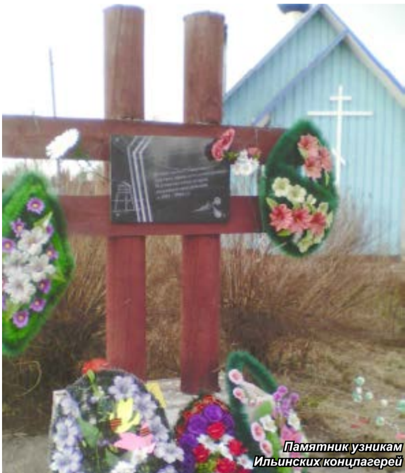
Памятник узникам Ильинских концлагерей