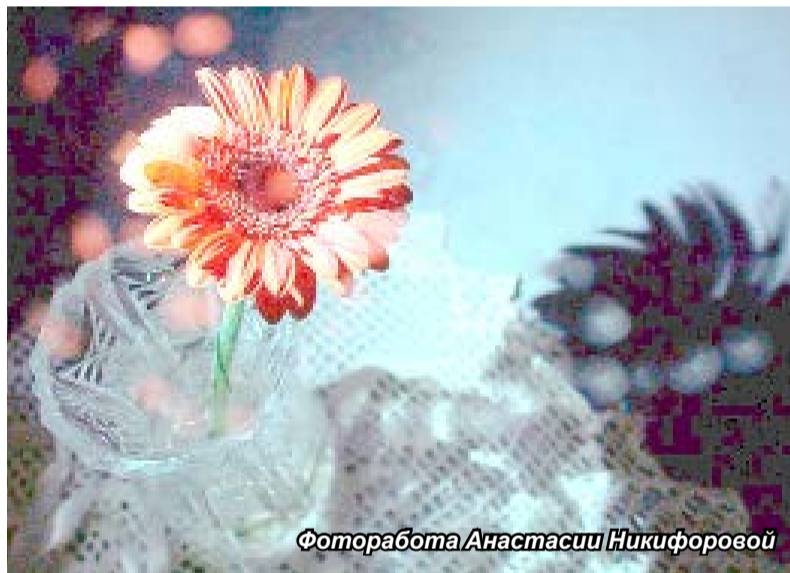
Фоторабота Анастасии Никифоровой

Для вознесенских школьников карантин не стал поводом для скуки – они приняли участие в международном интернет-конкурсе для детей, молодёжи и взрослых «Talent Presto». И результаты оказались впечатляющими.